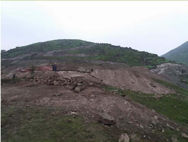
Depredando la Loma