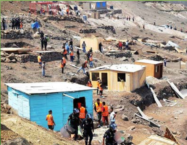
Expulsión de traficantes