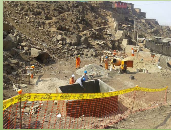
Obra publica destruyendo la