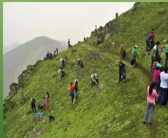
Campañas de limpieza