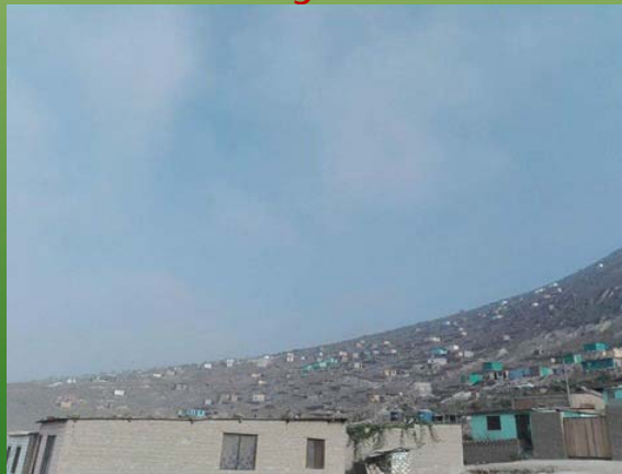
Traficantes dañando la Loma